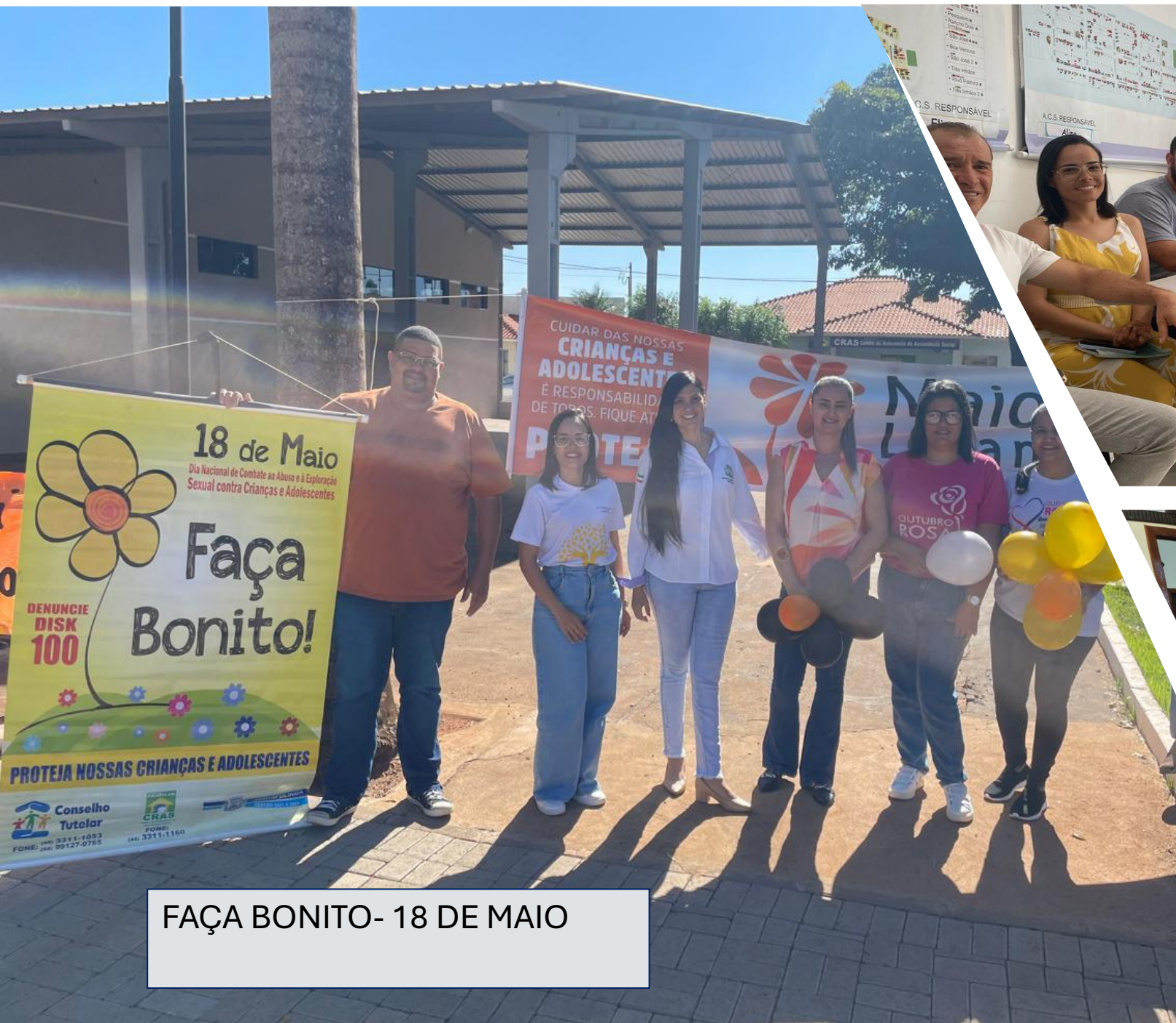
FAÇA BONITO- 18 DE MAIO