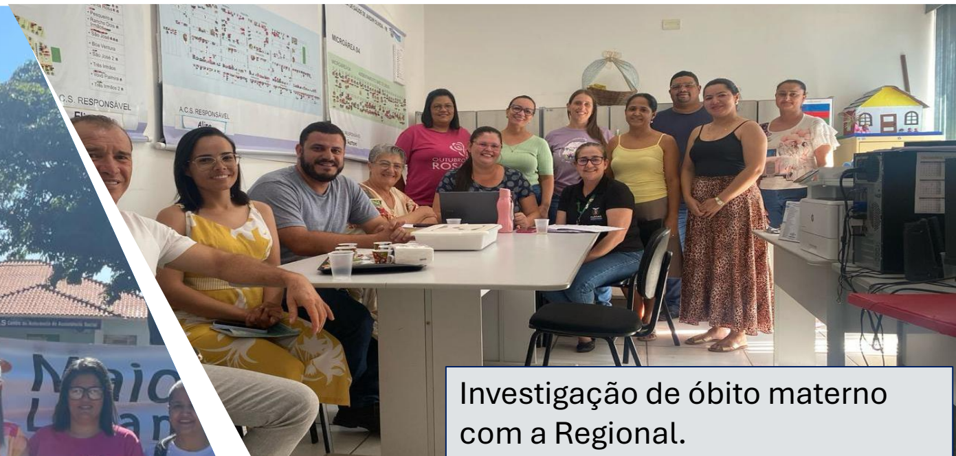
Investigação de óbito materno com a Regional.