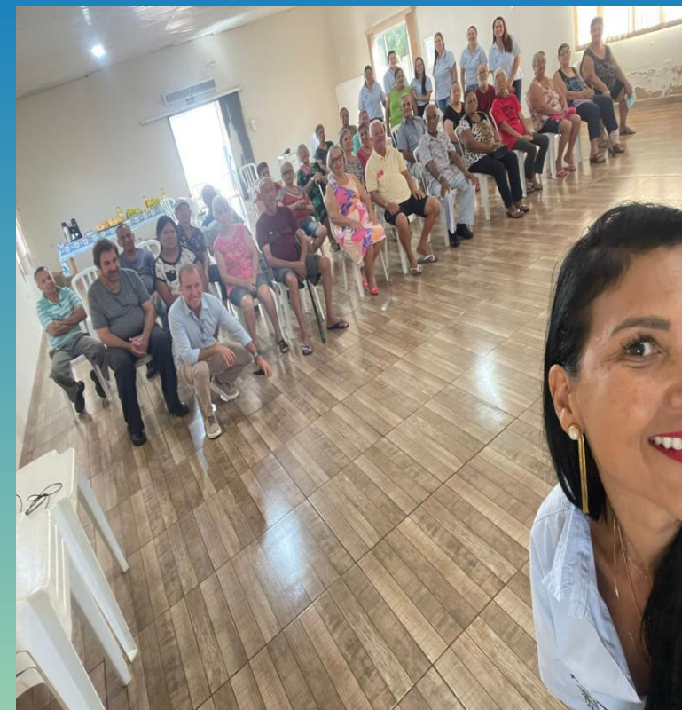
Grupo de HIPERDIA em Janeiro Cuidando da saúde mental.