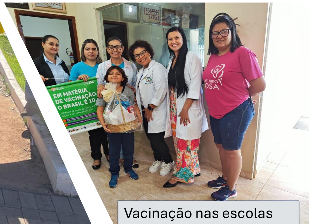
Vacinação nas escolas