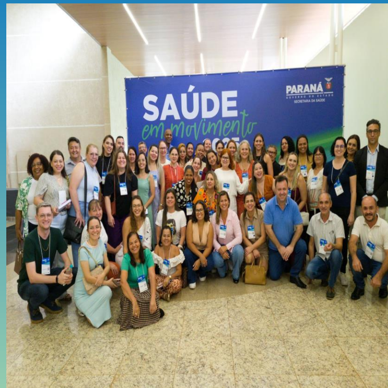
Saúde em Movimento em Foz do Iguaçu