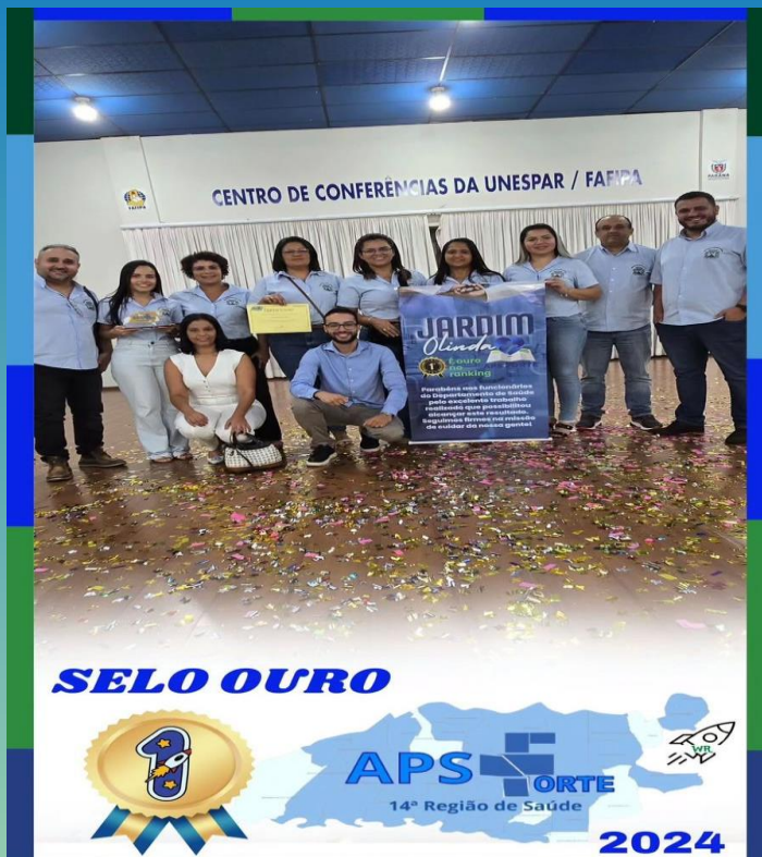
Troféu ouro APS+ Forte