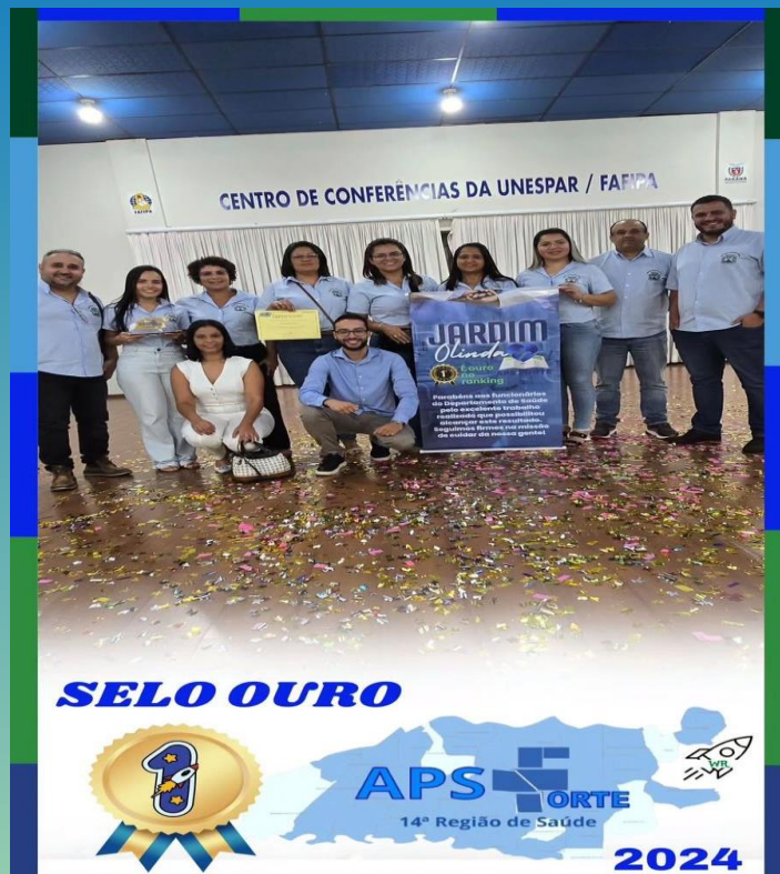
Troféu ouro APS+ Forte