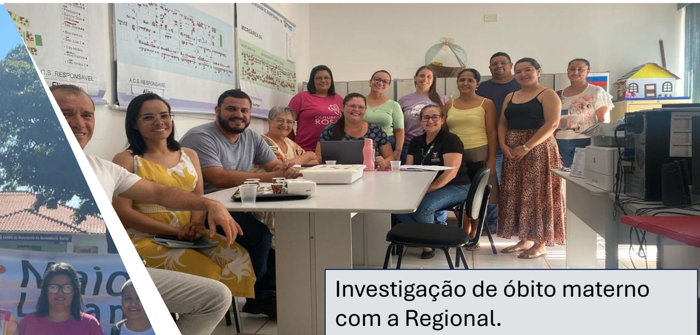
Investigação de óbito materno com a Regional.