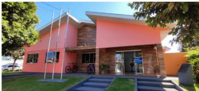
(Prédio da Prefeitura Municipal de Jardim Olinda – PR, local onde fica situado o RPPS de Jardim Olinda/PR)

A principal missão do RPPS de Jardim Olinda – PR é garantir os benefícios previdenciários aos Servidores Públicos Municipais, bem como garantir que tais benefícios alcancem ainda seus dependentes, com segurança e excelência.